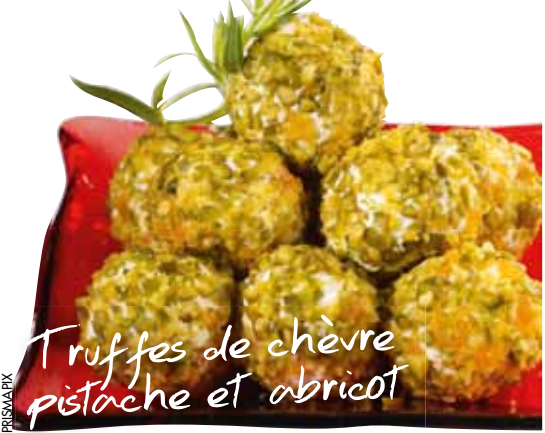
Truffes de chèvre pistache et abricot

> Répartissez les agrumes et les Saint-Jacques dans des coupelles. Décorez d'alfalfa et de chips de riz.