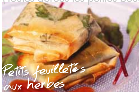
Petits feuilletés aux herbes

Il vous faut* : 8 feuilles de brick # 1 pomme de terre # 2 carottes # 1 oignon # 1 gousse d'ail # 1 bouquet d'herbes fraîches # 60 g de beurre # gingembre # curcuma # sel, poivre