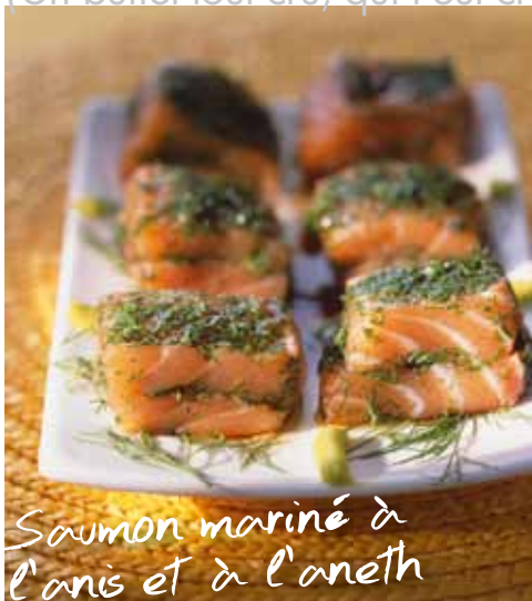
Saumon mariné à l'anis et à l'aneth

Il vous faut* : 500 g de filet de saumon frais sans peau ni arête # 1 bouquet d'aneth # 2 cl d'anisé (pastis) # 6 cuil.