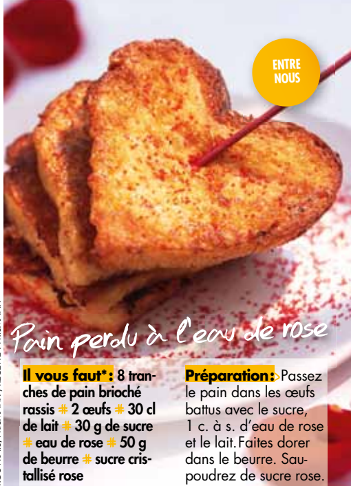
Pain perdu à l'eau de rose

> Faites un caramel blond en chauffant le sucre en morceaux avec 3 cuil. à soupe d'eau. Ajoutez la crème. Versez le caramel sur la brioche. Saupoudrez de sucre glace.