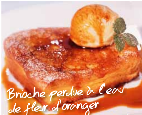
Brioche perdue à l'eau de fleur d'oranger

Il vous faut* : 4 tranches de brioche rassise # 2 œufs # 1 c. à s. de sucre en poudre # 1 sachet de sucre vanillé # 100 g de sucre en morceaux # eau de fleur d'oranger # 10 cl de lait # 80 g de beurre # 20 cl de crème liquide # sucre glace