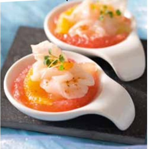
RECETTE : MOURGUES/PRISMAPIX

Arrosez-les de marinade et placez au frais pendant 15 minutes.