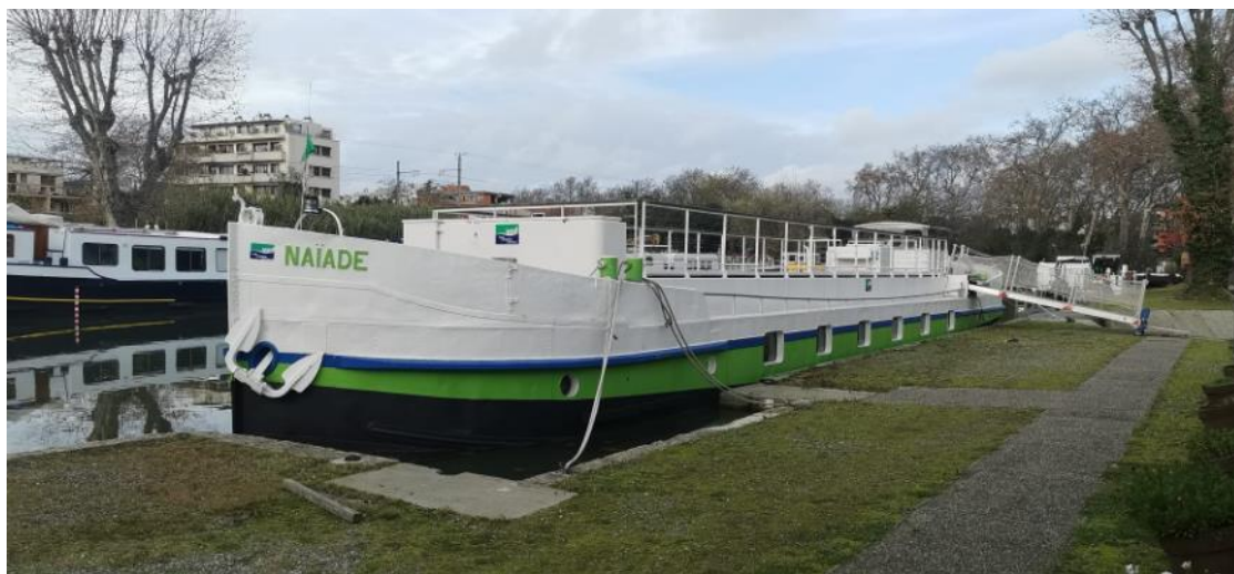
La péniche des Voies Navigables de France (VNF)