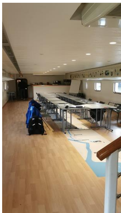
Salle de conférence de la péniche